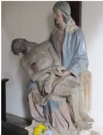
Gotická plastika Matky Boží Bolestné v kostele sv. Ducha v Praze

Logos – Syn Boží, druhá osoba Trojice, ale také Logos – řád, pořádek, systém – Boží řád, řád stvoření. Byl-li člověk stvořen k Božímu obrazu a podobenství (κατ'εἰκόνα