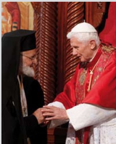
Duchovní protektor našeho Řádu patriarcha Gregorios III. uvítal papeže Benedikta XVI. při jeho nedávné návštěvě Libanonu.