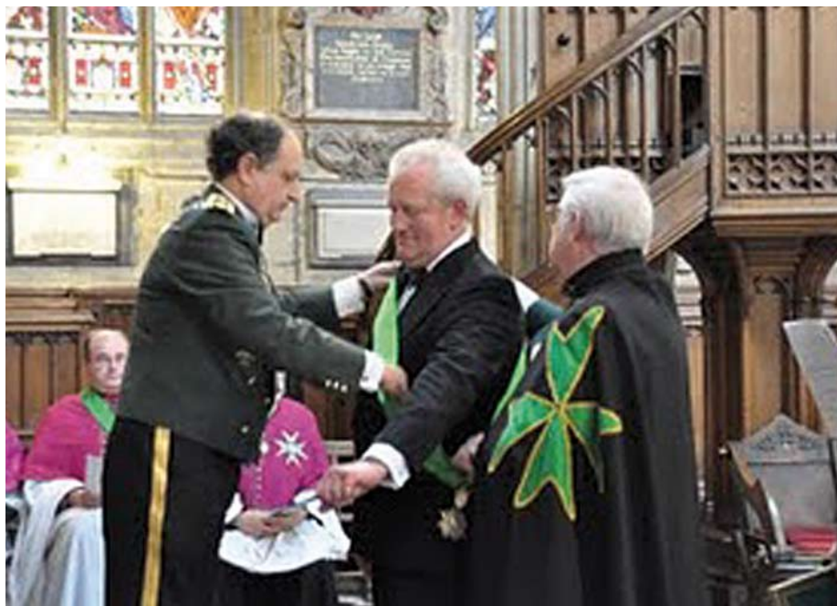
Velmistr intronizuje nového velkopřevora Anglie a Walesu.