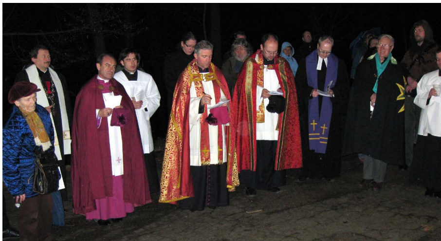
Na Zelený čtvrtek večer jsme se navzdory nepřízní počasí v hojném počtu zúčastnili již tradiční ekumenické Křížové cesty v Praze na Petříně. (vn)

Ruka natažená kvůli spasení až na kříž „Ukřižování je jeden z nejstrašnějších trestů smrti, který si lidský duch, tak vynalézavý ve všech způsobech trýznění, vymyslel. Všechny je překonává, crudelissimum teterimumque supplicium“ – „nejkrutější a nejohavnější trest smrti“, napsal Cicero. Křižování opravdu obsahuje všechno, co mělo