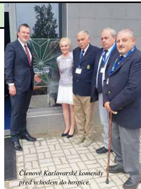
Členové Karlovarské komendy před vchodem do hospice.